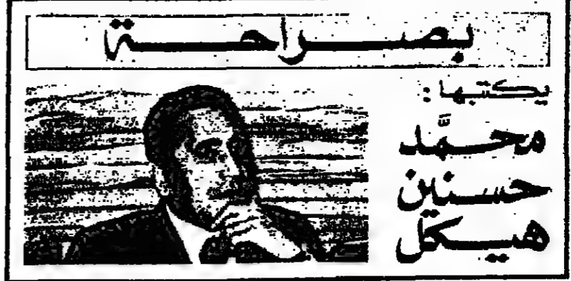
يكتبها: محمد حسين هيكل

أوروبا غير قادرة على أداء أي دور فعال، ومن ناحية أخرى لأن العرب لم يتسكروا بضرورة اشتراك أعضاء من أوروبا الغربية في الاجتماعات، ولو بوضع عضويتهم الدائمة في مجلس الأمن.